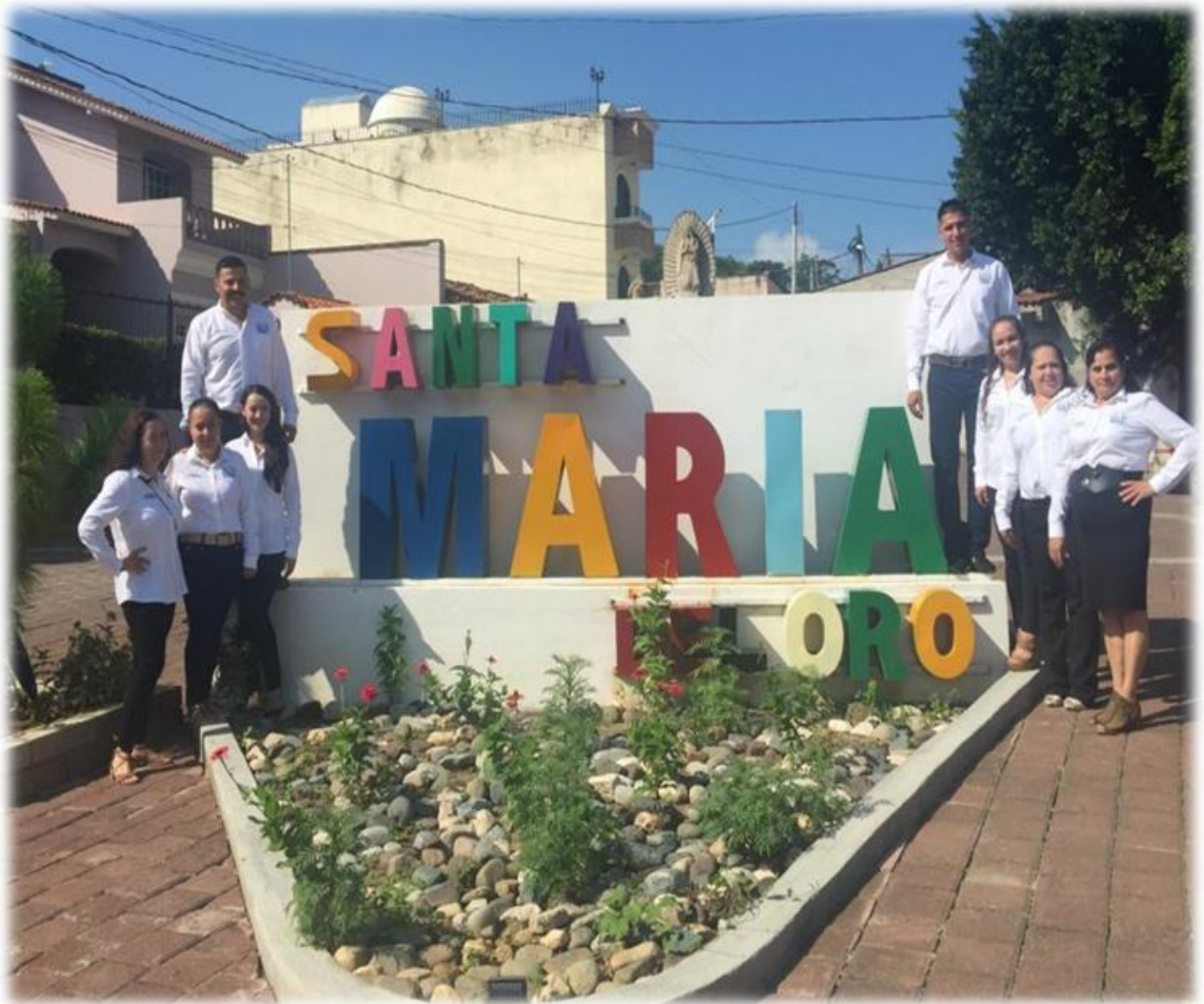
Sistema para el Desarrollo Integral de la Familia del Municipio de Santa María del Oro, Jalisco, México; 13 de Septiembre del 2021